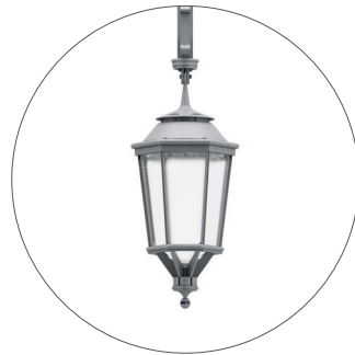
GC Gris claro