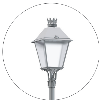
GC Gris claro