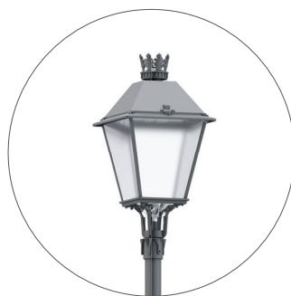
GO Gris oscuro