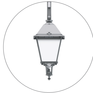
GC Gris claro