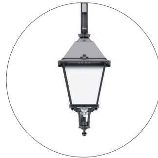
GO Gris oscuro