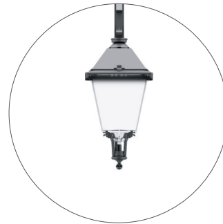
GO Gris oscuro