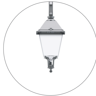
GC Gris claro