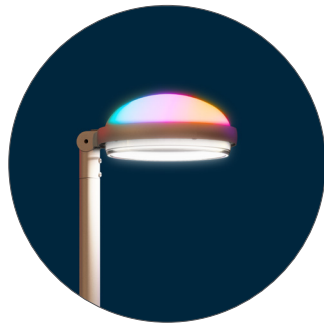
GC Gris claro