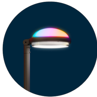
GO Gris oscuro